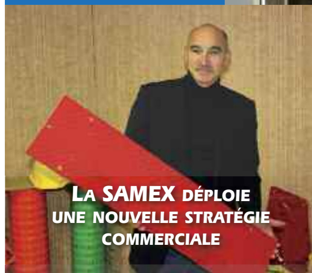
LA SAMEX DÉPLOIE UNE NOUVELLE STRATÉGIE COMMERCIALE