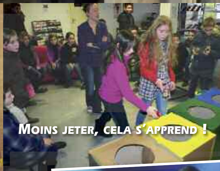
MOINS JETER, CELA S'APPREND !