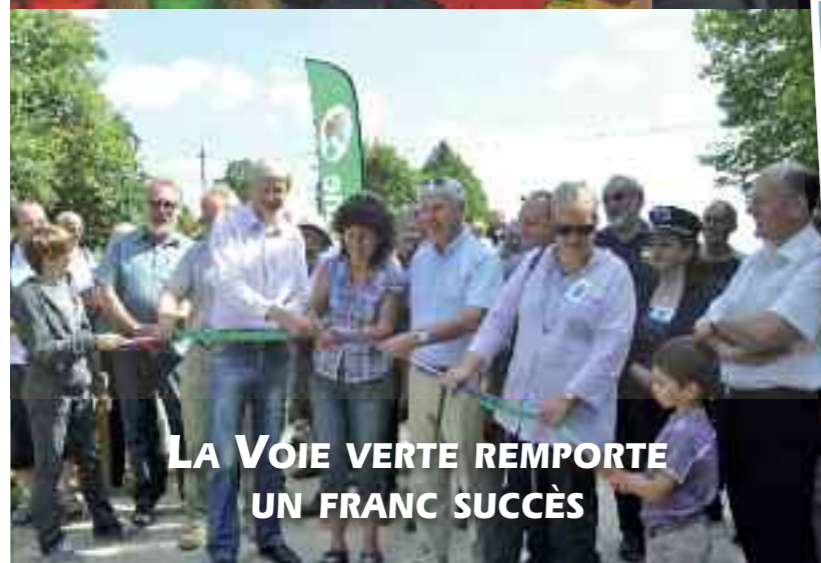
LA VOIE VERTE REMPORTE UN FRANC SUCCÈS